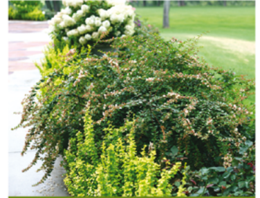
Abelia x grandiflora 'Minduo1' PP#24445 CBR#5236

Para ver preguntas e instrucciones de cuidado completas, visita ProvenWinners.com/ShrubCare