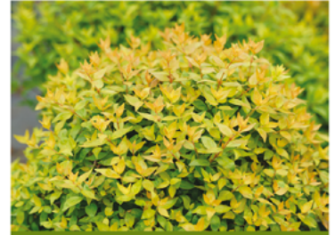
Abelia x grandiflora 'Minacara1' PPAF

Para ver preguntas e instrucciones de cuidado completas, visita ProvenWinners.com/ShrubCare