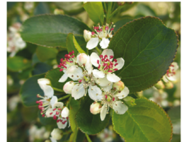
Aronia melanocarpa 'UCONNAM166' PP#28831 CBRAF

Para ver preguntas e instrucciones de cuidado completas, visita ProvenWinners.com/ShrubCare