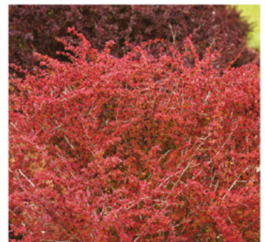
Berberis thunbergii 'Celeste' PP#24586

Para ver preguntas e instrucciones de cuidado completas, visita ProvenWinners.com/ShrubCare