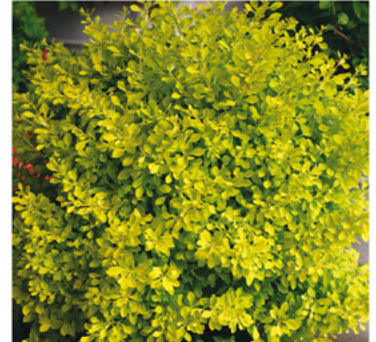
Berberis thunbergii 'Koren' PP#24818

Para ver preguntas e instrucciones de cuidado completas, visita ProvenWinners.com/ShrubCare