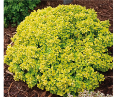
Berberis thunbergii 'Talago' PP#20602

Para ver preguntas e instrucciones de cuidado completas, visita ProvenWinners.com/ShrubCare