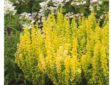
Berberis thunbergii 'Maria' PP#18082

Para ver preguntas e instrucciones de cuidado completas, visita ProvenWinners.com/ShrubCare