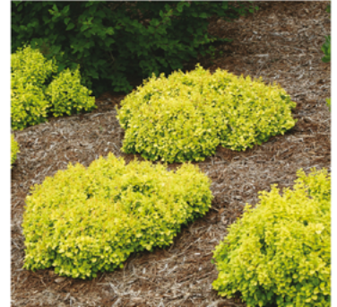
Berberis thunbergii 'Kasia' PP#24817

Para ver preguntas e instrucciones de cuidado completas, visita ProvenWinners.com/ShrubCare