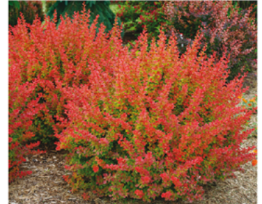
Berberis thunbergii 'O'Byrne' PP#26546

Para ver preguntas e instrucciones de cuidado completas, visita ProvenWinners.com/ShrubCare