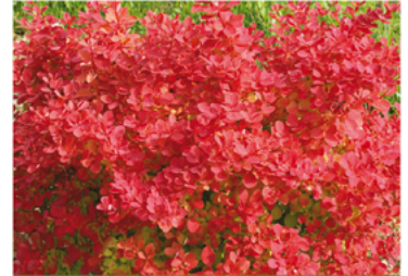
Berberis thunbergii 'NCBT2' PPAF

Para ver preguntas e instrucciones de cuidado completas, visita ProvenWinners.com/ShrubCare