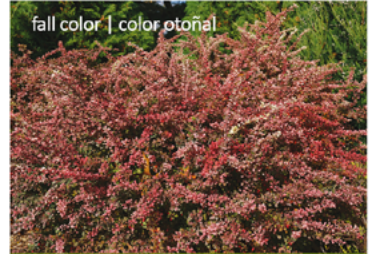
fall color | color otoñal

Para ver preguntas e instrucciones de cuidado completas, visita ProvenWinners.com/ShrubCare