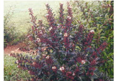
Callicarpa x 'NCCX2' PP#28312 CBRAF

Para ver preguntas e instrucciones de cuidado completas, visita ProvenWinners.com/ShrubCare