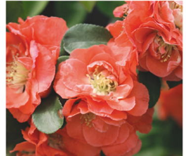
Chaenomeles speciosa 'NCCS4' PPAF

Para ver preguntas e instrucciones de cuidado completas, visita ProvenWinners.com/ShrubCare