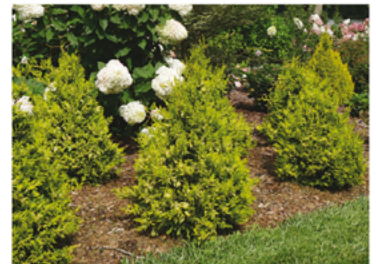
Chamaecyparis pisifera 'FARROWCGMS' PPAF

Para ver preguntas e instrucciones de cuidado completas, visita ProvenWinners.com/ShrubCare