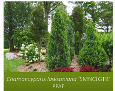
Chamaecyparis lawsoniana 'SMNCLGTB' PPAF

Para ver preguntas e instrucciones de cuidado completas, visita ProvenWinners.com/ShrubCare