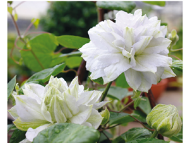
Clematis 'Diamond Ball' PP#24045 CBR#5158

Para ver preguntas e instrucciones de cuidado completas, visita ProvenWinners.com/ShrubCare