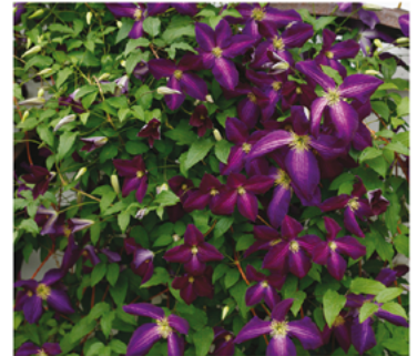
Clematis 'Zojapur' PP#20343

Para ver preguntas e instrucciones de cuidado completas, visita ProvenWinners.com/ShrubCare