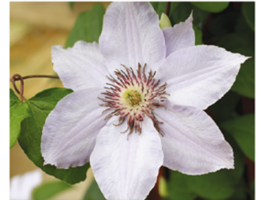
Clematis 'Zostiva' PP#20372

Para ver preguntas e instrucciones de cuidado completas, visita ProvenWinners.com/ShrubCare