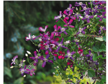
Clematis 'Sweet Summer Love' PP#24044 CBR#5303

Para ver preguntas e instrucciones de cuidado completas, visita ProvenWinners.com/ShrubCare