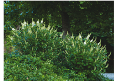
Clethra alnifolia 'Crystalina' PP#21561 CBR#4160

Para ver preguntas e instrucciones de cuidado completas, visita ProvenWinners.com/ShrubCare