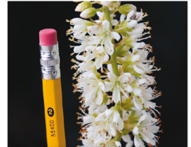
Clethra alnifolia 'Caleb' PP#21589 CBR#4167

Para ver preguntas e instrucciones de cuidado completas, visita ProvenWinners.com/ShrubCare