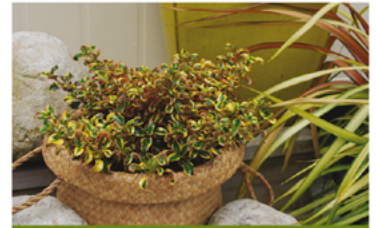
Coprosma repens 'Golden Star' PP#28272

Para ver preguntas e instrucciones de cuidado completas, visita ProvenWinners.com/ShrubCare