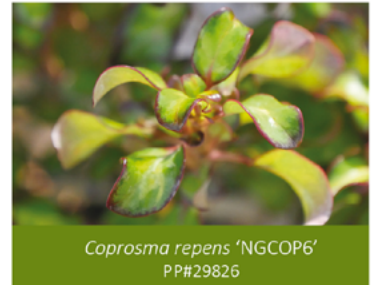
Coprosma repens 'NGCOP6' PP#29826

Para ver preguntas e instrucciones de cuidado completas, visita ProvenWinners.com/ShrubCare