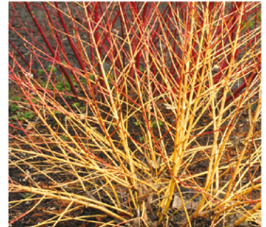
Cornus sanguinea 'Cato' PP#19892

Para ver preguntas e instrucciones de cuidado completas, visita ProvenWinners.com/ShrubCare