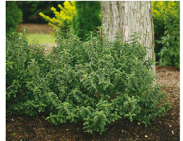
Cornus stolonifera 'Neil Z' PP#24812 CBR#4767

Para ver preguntas e instrucciones de cuidado completas, visita ProvenWinners.com/ShrubCare