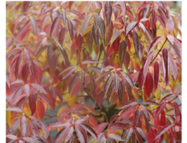
Cornus obliqua 'Powell Gardens' PP#27873

Para ver preguntas e instrucciones de cuidado completas, visita ProvenWinners.com/ShrubCare