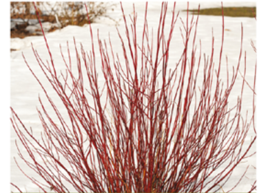
Cornus stolonifera 'Farrow' PP#18523

Para ver preguntas e instrucciones de cuidado completas, visita ProvenWinners.com/ShrubCare