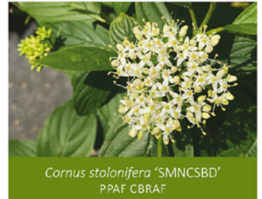
Cornus stolonifera 'SMNCSBD' PPAF CBRAF

Para ver preguntas e instrucciones de cuidado completas, visita ProvenWinners.com/ShrubCare