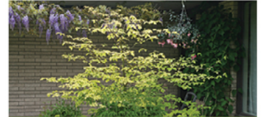
Cornus alternifolia 'Wstackman' PP#11287

Para ver preguntas e instrucciones de cuidado completas, visita ProvenWinners.com/TreeCare