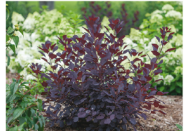
Cotinus coggygria 'NCCO1' PPAF CBRAF

Para ver preguntas e instrucciones de cuidado completas, visita ProvenWinners.com/ShrubCare