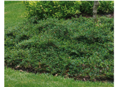
Cotoneaster procumbens 'Gerald' PP#22760

Para ver preguntas e instrucciones de cuidado completas, visita ProvenWinners.com/ShrubCare