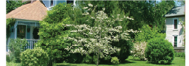
Crataegus crus-galli var. inermis 'Cruzam'

Para ver preguntas e instrucciones de cuidado completas, visita ProvenWinners.com/TreeCare