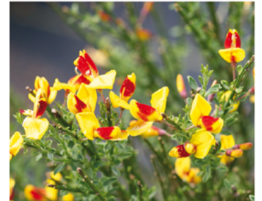
Cytisus scoparius 'SMNCSCRY' PPAF

Para ver preguntas e instrucciones de cuidado completas, visita ProvenWinners.com/ShrubCare