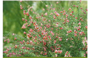
Cytisus scoparius 'SMNCSDRY' PPAF

Para ver preguntas e instrucciones de cuidado completas, visita ProvenWinners.com/ShrubCare