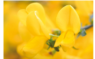
Cytisus scoparius 'SMSCGF' PP#26616

Para ver preguntas e instrucciones de cuidado completas, visita ProvenWinners.com/ShrubCare