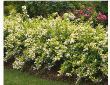
Deutzia gracilis 'Duncan' PP#16098 CBR#2640

Para ver preguntas e instrucciones de cuidado completas, visita ProvenWinners.com/ShrubCare