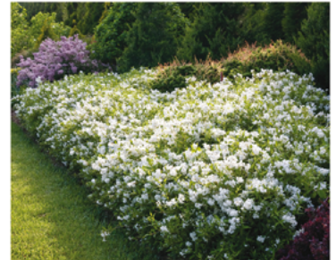
Deutzia 'NCDX1' PP25916 CBR#5078

Para ver preguntas e instrucciones de cuidado completas, visita ProvenWinners.com/ShrubCare