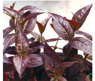
Diervilla rivularis 'SMNDRSF' PP#27550 CBRAF

Para ver preguntas e instrucciones de cuidado completas, visita ProvenWinners.com/ShrubCare