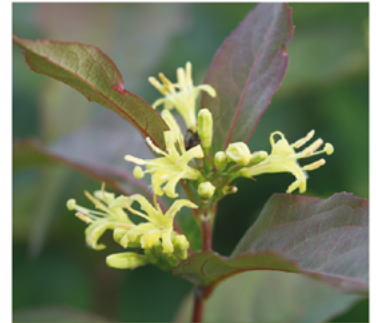
Diervilla 'G2X885411' PP#28403 CBRAF

Para ver preguntas e instrucciones de cuidado completas, visita ProvenWinners.com/ShrubCare