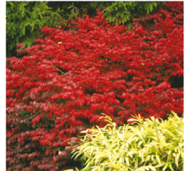
Euonymus alatus 'Select'

Para ver preguntas e instrucciones de cuidado completas, visita ProvenWinners.com/ShrubCare