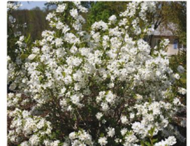
Exochorda 'Niagara' PP#21665 CBR#4768

Para ver preguntas e instrucciones de cuidado completas, visita ProvenWinners.com/ShrubCare