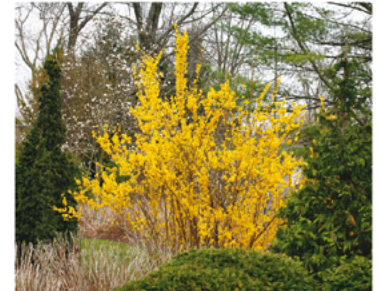
Forsythia x intermedia 'Mindor' PP#19321

Para ver preguntas e instrucciones de cuidado completas, visita ProvenWinners.com/ShrubCare