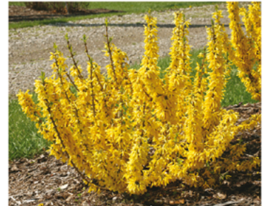
Forsythia "NIMBUS" PP#23838 CBR#4608

Para ver preguntas e instrucciones de cuidado completas, visita ProvenWinners.com/ShrubCare