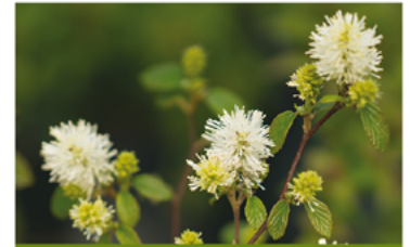
Fothergilla x intermedia 'ALICE' PPAF CBRAF

Para ver preguntas e instrucciones de cuidado completas, visita ProvenWinners.com/ShrubCare