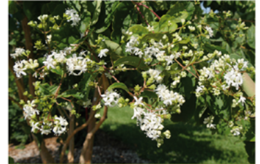
Heptacodium miconioides 'SMNHMRF' PPAF

Para ver preguntas e instrucciones de cuidado completas, visita ProvenWinners.com/ShrubCare