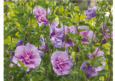
Hibiscus syriacus 'Notwoodone' PP#12619

Para ver preguntas e instrucciones de cuidado completas, visita ProvenWinners.com/ShrubCare