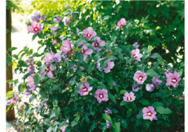
Hibiscus syriacus 'SHIMRV24' PP#26374 CBRAF

Para ver preguntas e instrucciones de cuidado completas, visita ProvenWinners.com/ShrubCare