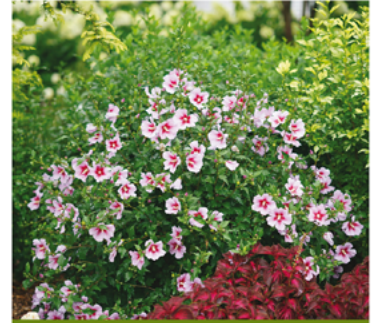
Hibiscus syriacus 'ILVO37' PP#27285 CBRAF

Para ver preguntas e instrucciones de cuidado completas, visita ProvenWinners.com/ShrubCare