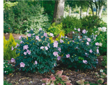
Hibiscus x 'Rosina' PPAF

Para ver preguntas e instrucciones de cuidado completas, visita ProvenWinners.com/ShrubCare