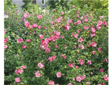
Hibiscus syriacus 'SHIMCR1' PP#26222

Para ver preguntas e instrucciones de cuidado completas, visita ProvenWinners.com/ShrubCare